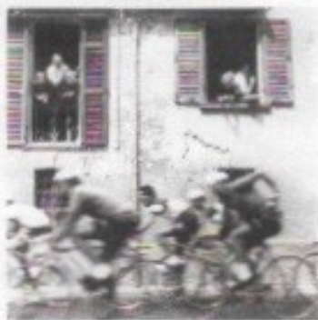
Stanislao Farri, Reggio Emilia, passe il giro, stampa 6/11 su carta fotografica, cm 21,3 x 29,2, 1956.

O ltre cinquant'anni di storia reggiana in 140 immagini, attraverso monumenti, piazze, giardini e luoghi simbolo dell'identità sociale e culturale: la Galleria VV8artecontemporanea di Reggio Emilia presenta, fino al 12 gennaio 2014, un progetto monografico dedicato a Stanislao Farri, tra i protagonisti della fotografia italiana. Come spiega il curatore, Sandro Parmeggiani «Dopo aver svolto il lavoro di tipografo, Farri si dedica esclusivamente alla fotografia, soprattutto in bianco e nero, dalla metà degli anni Cinquanta [...]».