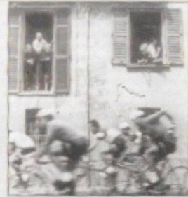
«Il Giro d'Italia attraverso Reggio Emilia» in una fotografia di Stanislao Farri del 1956

Nell'autunno, VV8 presenta una mostra del decano dei fotografi reggiani, Stanislao Farri (Bibbiano, Reggio Emilia, 1924). Dopo avere svolto il lavoro di tipografo, Farri si dedica esclusivamente alla fotografia, soprattutto in bianco e nero, dalla metà degli anni Cinquanta, affermandosi rapidamente sia nell'attività professionale (fotografia industriale e pubblicitaria, di opere d'arte e di architetture) che amatoriale. Svoige, in particolare, un'intensa, costante ricerca di registrazione e di documentazione della civiltà e della cultura della sua terra, giacché per lui la fotografia mai