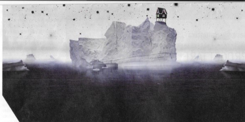
The perfect ocean, 2014 digital print on cotton paper B/W Hahnemühle, 100x100 cm

Collezionista di immagini, Aqua Aura non è un fotografo nel senso tradizionale del termine, piuttosto un alchimista, che fonde diversi scatti autografi in una nuova cornice. Il suo nome d'arte, tratto da un cristallo naturale esposto ai fumi dell'oro, indica un percor-