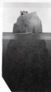
Birthplace, 2014 digital print on cotton paper B/W Hahnemühle, 180x120 cm